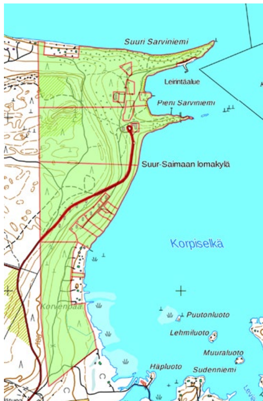
Kuva 1: Suunnittelualueen rajausta ja sijainti on osoitettu vihreällä värillä.

Suunnittelualueen rajausta on esitetty alla olevalla kartalla. Kumottavan ranta-asemakaavan pinta-ala on n. 80,8 ha.